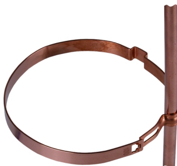
Zobrazení je nezávazné